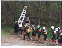
野麦峠まつり(5月末開催)