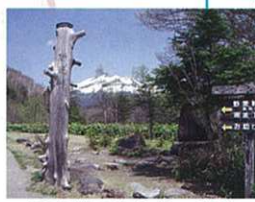
野麦峠頂上からの眺め