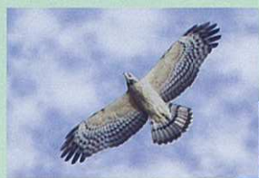
タカの渡り 見頃:9月中旬~10月上旬