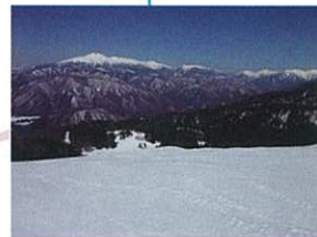
野麦峠スキー場より乗鞍岳を望む