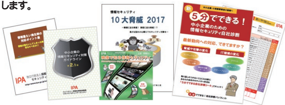
セミナー補助教材の一例

中小企業が情報セキュリティ対策を実施・支援する際に必要な、実践的な知識を学んでいただくために、全国各地で無料セミナーを開催します。