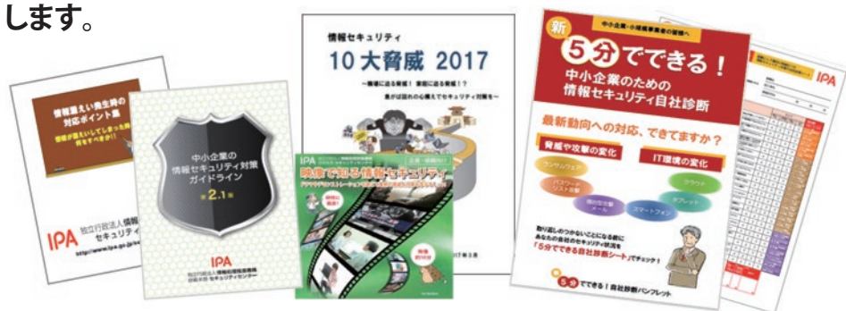
セミナー補助教材の一例

中小企業が情報セキュリティ対策を実施・支援する際に必要な、実践的な知識を学んでいただくために、全国各地で無料セミナーを開催します。