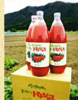
●手作りトマトジュース